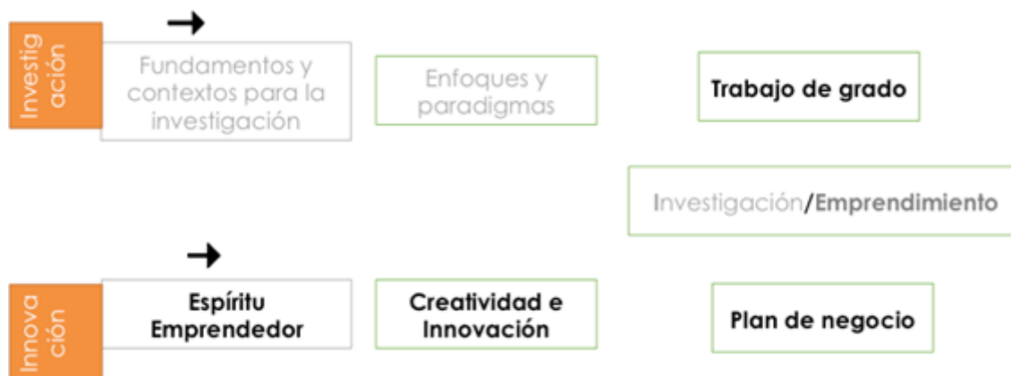
Figura 2. Propuesta curricular de la formación en innovación y emprendimiento

Todas las fases del modelo se operacionalizan mayormente a través del currículo al igual que se realizan actividades extracurriculares, incorporando en ello el portafolio de ideas de proyectos de I+D+i y la teoría de sistemas de innovación. La propuesta curricular consta de tres asignaturas, dos (2) de ellas de carácter obligatorio y una optativa, que se imparten en paralelo con la ruta de investigación formativa que también diseñó la Corporación. En programas de diez (10) semestres, ambas rutas inician la formación obligatoria en el semestre VII, continúa con el VIII y finalmente el estudiante tiene la opción de profundizar en investigación o en emprendimiento en el semestre IX. Una vez concluida la ruta, se le da la oportunidad al estudiante que profundizó en la ruta de innovación y emprendimiento que pueda aspirar a su título profesional mediante la modalidad de plan de negocio como opción de grado, tal como se evidencia en la figura 2.