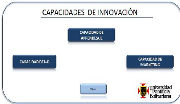
FIGURA 6. Módulo para selección de capacidades