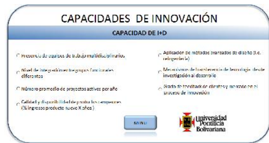
FIGURA 1. Módulo para las capacidades de innovación

Las cuales se han implementado en la herramienta a través de la siguiente interfaz: