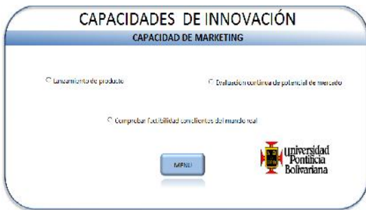
FIGURA 3. Módulo para las capacidades de marketing

Las cuales se han implementado en la herramienta a través de la siguiente interfaz: