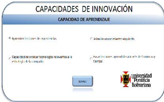
FIGURA 2. Módulo para las capacidades de aprendizaje