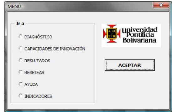
FIGURA 4. Opciones de menú de la herramienta

Inicialmente la herramienta presenta una interfaz de menú donde se seleccionan las diferentes opciones, como se muestra en la siguiente gráfica.