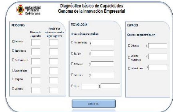
FIGURA 5. Módulo para diagnóstico básico de capacidades

Sobresalen principalmente la opción de diagnóstico donde se ingresa la información general de toda la empresa, el cual es llamado “Diagnóstico básico de capacidades”, allí se evalúan las personas, la tecnología y el espacio como se muestra en la siguiente Figura.