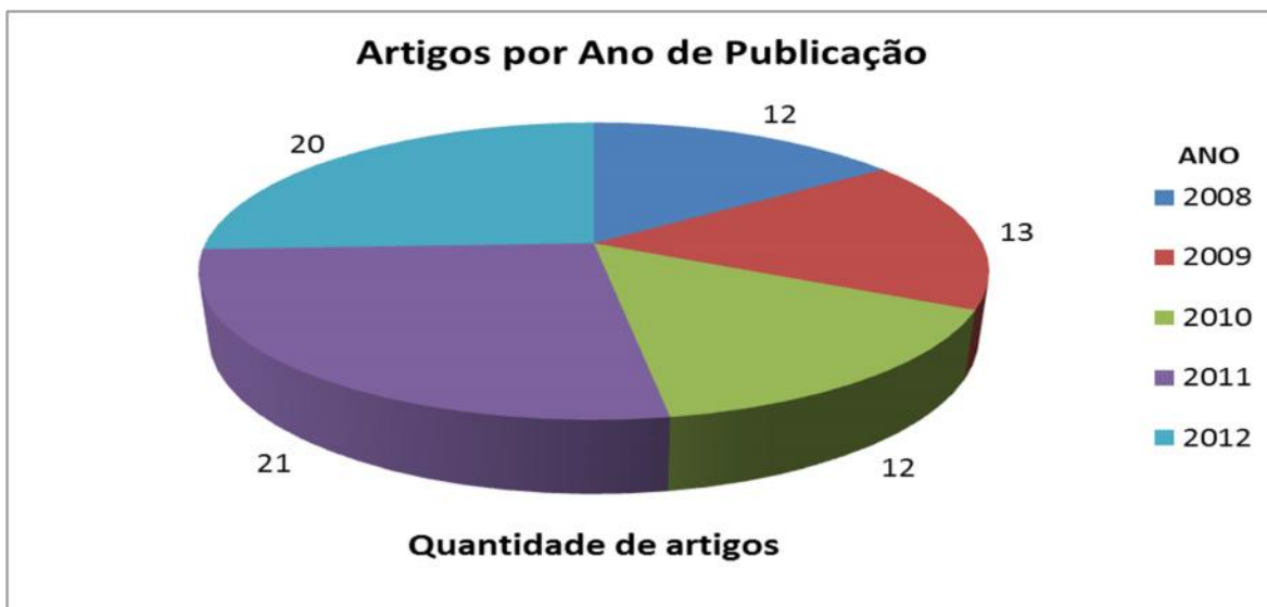
Figura 1: artigos da REDALYC por ano de publicação